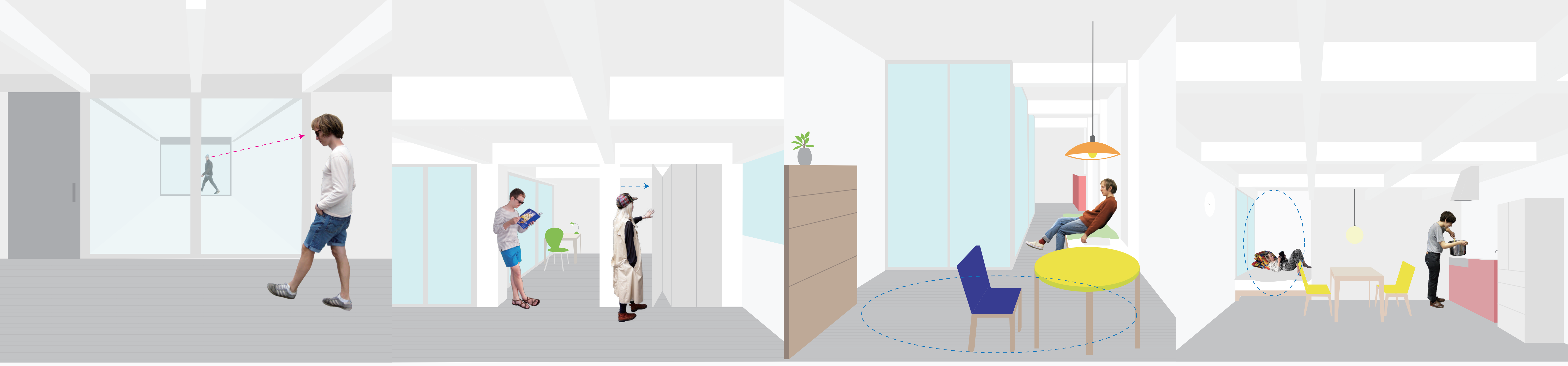
ヴォイドのそばに小さなスペースを設ける